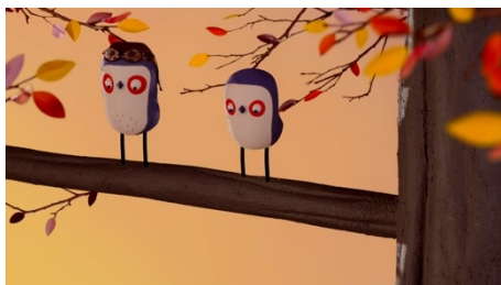
FEAR OF FLYING Connor Finnegan