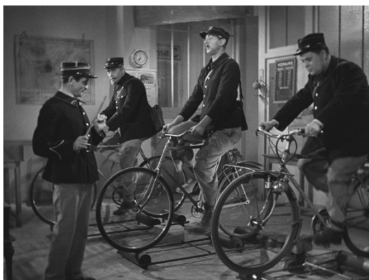
L'ÉCOLE DES FACTEURS Jacques Tati